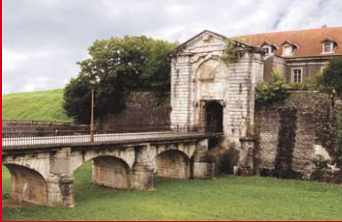
Porte de Metz

The history of Toul's fortifications already started in the times of the wars between Gauls and Romans. In the 4th century the inhabitants of the town of Toul erected a wall of 12 m height to protect themselves against raids of ancient Germanic tribes. This was converted in the 13th century into a typical medieval defensive wall for the town which had grown in the mean time. In the 17th century the French fortress builder Vauban enriched the fortifications with bastions. The borders of France were changed by the German/French war of 1870/71. Therefore the French military engineer Séré de Rivières made Toul into a vast fortified camp, like also the towns of Verdun, Epinal and Belfort. The authors describe in detail the planning and building of this large fortress. They also show the reforms of French artillery necessary after 1871 and its development and mode of operation until WW I. Closely connected to the extension of the fortifications is the growth of the French air force and Toul becoming an important airfield, both described in the book. The authors illustrate all this with photos of their own and old picture postcards, as well as new plans of all fortifications they have specially drawn for this book. All this combines to a magnificent book not only about fortified Toul but also French fortifications and their weaponry from the 1870s to WW I. Don't miss it.